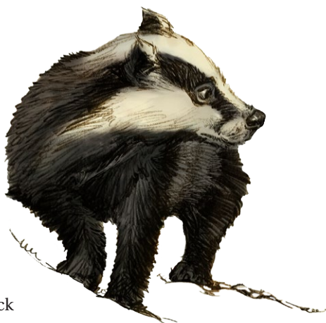
Tegning: Claus Rye Schierbeck