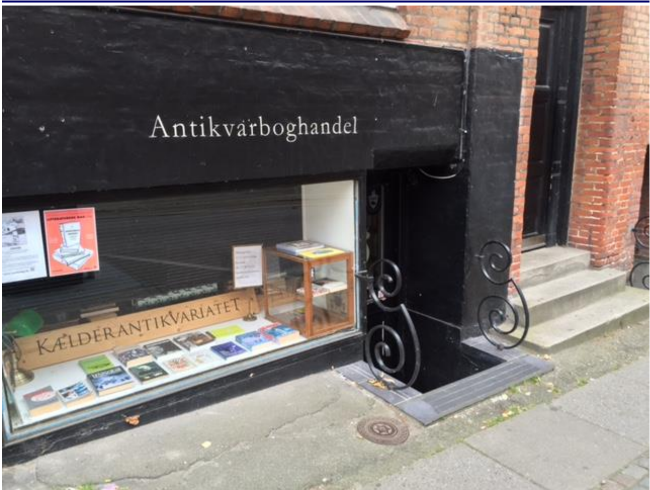
Kælderantikariatet J. M. Mørksgade Aarhus (22. 08. 2016.)