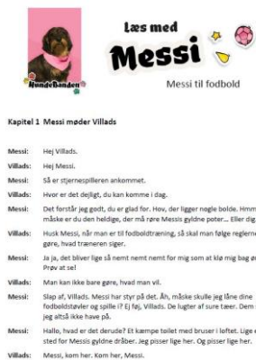
Uddrag af læseteater