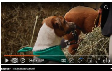
Chloé møder Louisi udsendelsen