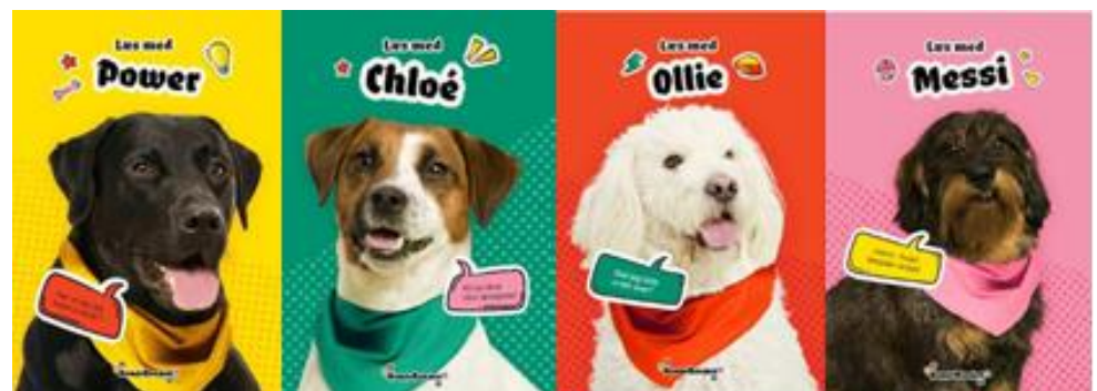
Uddrag af læseteater