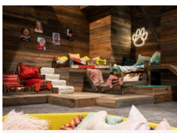
Baggrunde til stopmotion

På læsespoeret findes både udfyldte kæledyrskort på Power, Chloé, Ollie og Messi og tomme kæledyrskort, som eleverne kan udfylde.