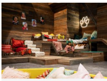
Baggrunde til stopmotion

På læsespoet findes både udfyldte kæledyrskort på Power, Chloé, Ollie og Messi og tomme kæledyrskort, som eleverne kan udfylde.