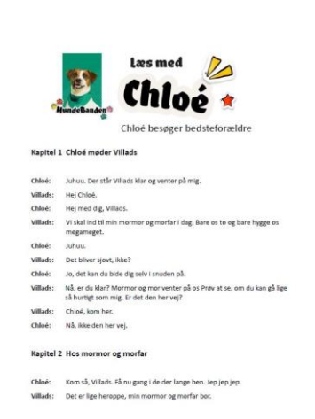
Uddrag af læseteater

Tv-udsendelsen støtter eleverne i afkodning af ordene, som er nedskrevet talesprog i bedste hundestil. Idéen med læseteateret er, at eleverne først læser teksten nogle gange, mens de ser tv-udsendelsen med lyd, så de øver afkodning, får fornemmelse af tempo, tryk og pauser og bliver inspireret til at fokusere på styrke og toneleje. Efter noget tid kan du opfordre dem til at skrue ned for lyden eller slukke helt, så de overtager speaket. Vær opmærksom på, at tv-udsendelserne kan afspilles langsommere på PC, hvis nogle elever har svært ved at kunne nå at afkode i normaltempo.