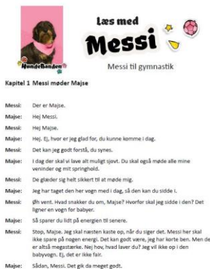
Uddrag af læseteater

Der er lavet 12 strategikort, som kan bruges til læseteateret – og dine elever kan sikkert også have glæde af dem, når de læser andre tekster