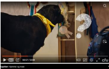
Power undersøger Majsens værelse