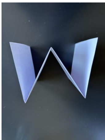
Skabelon til W-bog