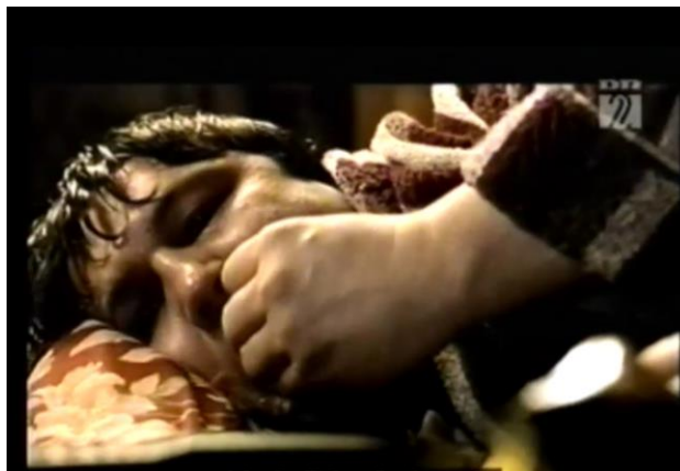
Skærbilledet er fra TV0000006275