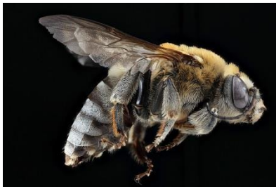
Fx: øjne, bagkrop, brun, følehorn, gennemsigtig, vinger