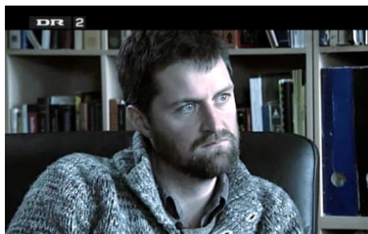
Billederne er fra tv-udsendelsen