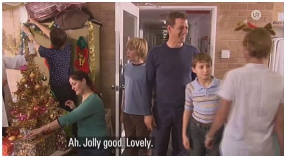
Billede fra 'Joy to the World' SVT2, 2012

Den pædagogiske vejledning indeholder ideer til før, under og efter opgaver til arbejdet med filmens indhold og hovedtematikker.