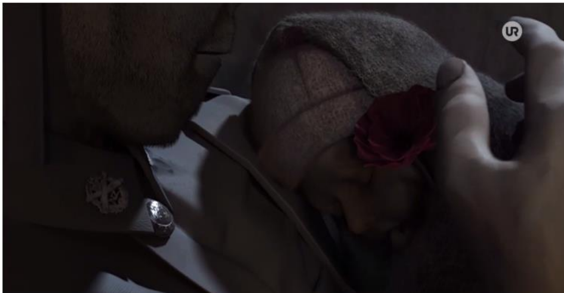
Dette billede er klip fra tv-udsendelsen SVT2 TV0000026006

Kortfilmen er baseret på personlig beretning fra en soldat i krig.