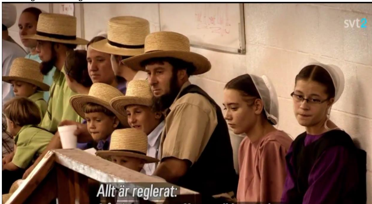
billedet er fra SV2 15.9.13 Leva som amish, afsnit 1

Denne pædagogiske vejledning indeholder ideer til arbejdet med de enkelte kapitler i filmen både før, under og efter visningen af udsendelsen.