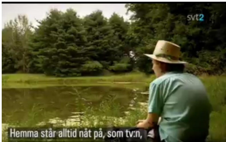
billedet er fra SV2 15.9.13 Leva som amish, asfnit 1