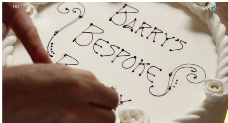
Skærbilledet er fra SVT2014

Denne pædagogiske vejledning indeholder ideer til arbejdet med tema og indhold før, under og efter udsendelsen.