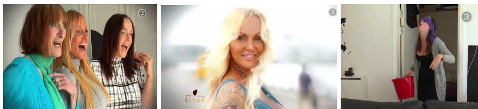
Billederne er fra "Familien fra Bryggen", DR3.