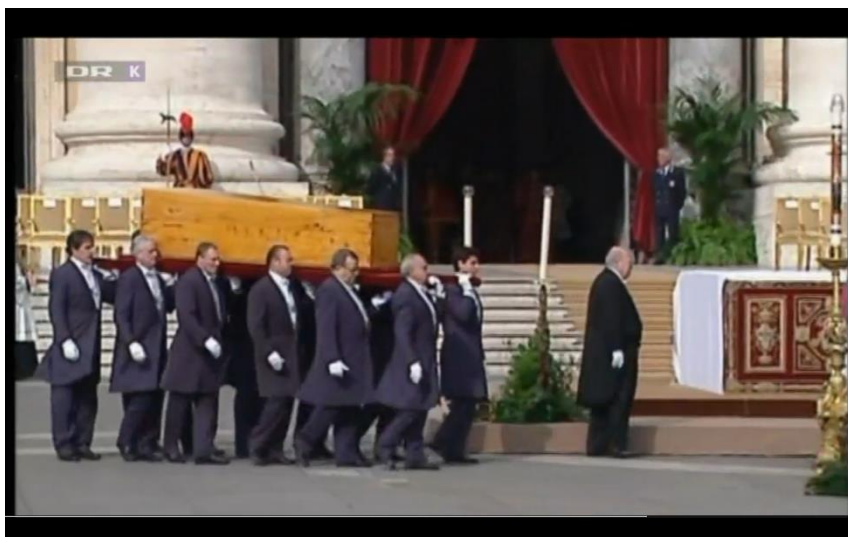
Skærbillede fra tv-udsendelsen: De 5 skarpe om døden (DR K)

Der gives i vejledningen ligeledes forslag til, hvordan der kan arbejdes med den sproglige dimension i faget.