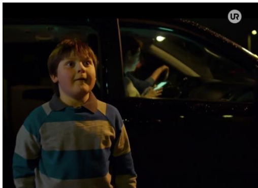
Skærbillede fra TV udsendelsen TV0000102332

Denne pædagogiske vejledning indeholder ideer til arbejdet med kortfilmen før og efter udsendelsen. Vejledningen fokuserer på meddigtning og videreudvikling af plottet.