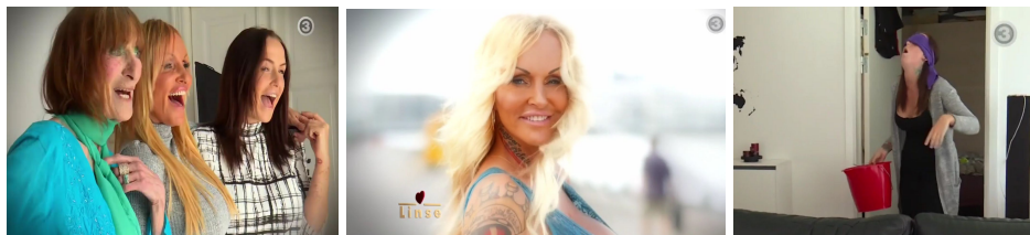
Billederne er fra "Familien fra Bryggen", DR3.