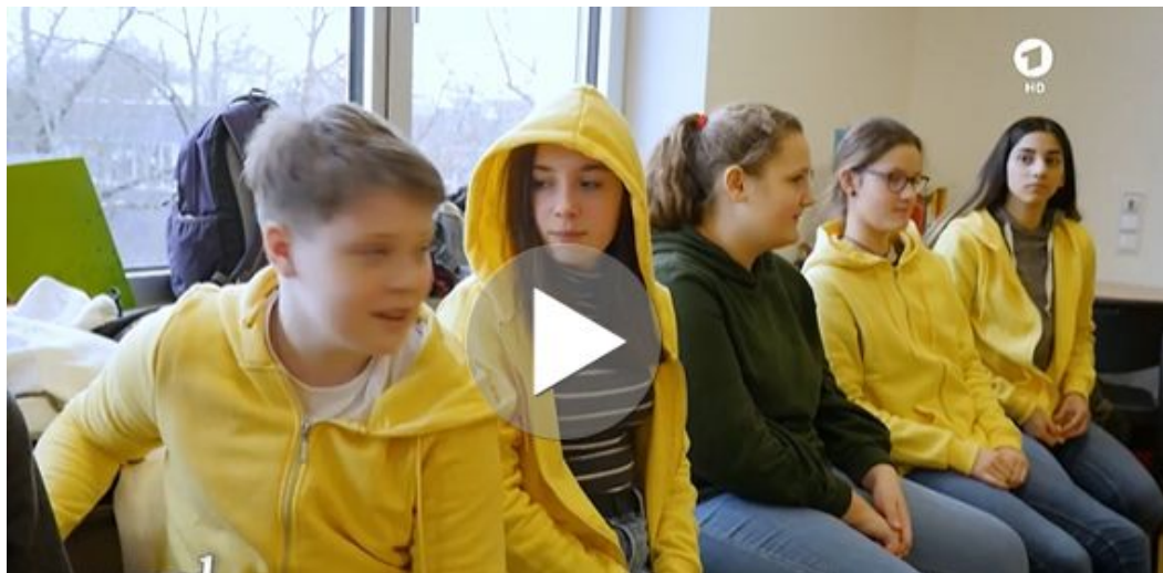
Billedet er taget fra tv-udsendelsen

I vejledningen er lytning og mundtlig kommunikation i fokus, i forhold til at eleverne får oparbejdet sig et relevant ordforråd som sætter dem i stand til at samtale om, udveksle budskaber og holdninger om tøj, mode, samt præsentere nære emner.