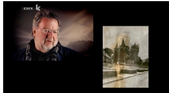
Billedet er fra tv- udsendelsen Danmark under Forvandling – Peter Brandes, DR K 20/3 2010

Udvalgte danske fotografer fik i 2008 til opgave at fotografere Danmark gennem et år. Tilsammen skulle de fastholde et øjebliksbillede af det danske landskab, som de så det på daværende tidspunkt. Projektet giver et øjebliksbillede af landet til bevaring for eftertiden. I hver af udsendelserne præsenterer en af fotograferne deres projekt. Alle fotograferne har taget billeder under temaet igennem et år.