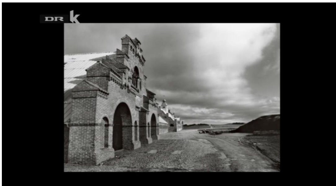
Billedet er fra tv- udsendelsen Danmark under Forvandling – Kirsten Klein, DR K 20/3 2010

På dr.dk/undervisning ligger serien også tilgængelig med alle 14 udsendelser. Her findes yderligere fotograferne: Christina Capetillo, Astrid Kruse, Nikolai Howalt, Joakim Eskildsen