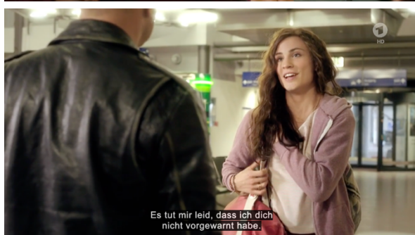
Billederne stammer fra tv-filmen (ARD 2022)