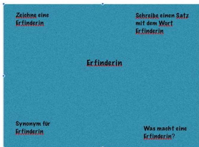
Illustration Claudia Jans

Resultaterne kan sættes op i klassen eller på en elektronisk opslagstavle https://padlet.com/