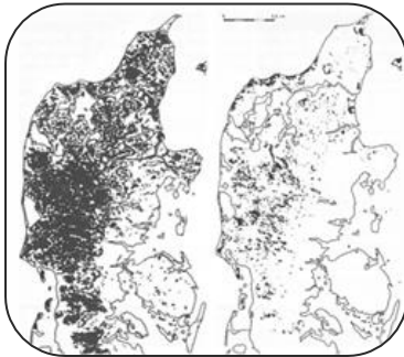
Kort over hedelandet. Kortet til venstre er fra 1800, kortet til højre fra 1940.