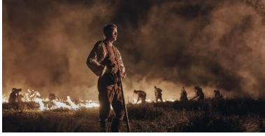
Klip fra filmen. Heden brændes af.