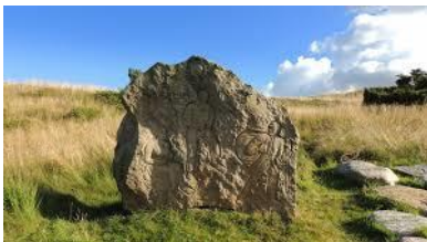
Kongenshus mindepark.