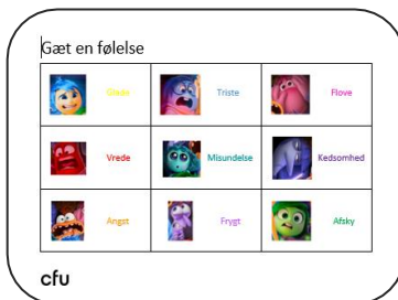
Elevarket til Gæt og grimasser

Hvad betyder ordet Nostalgi, og hvorfor er hun en gammel dame, der hele tiden bliver forvist fra kontrolrummet?