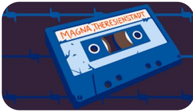
Tiden vi aldrig talte om er en del af serien Radiofortællinger fra DRLyd, som alle tilhører genren faktions-podcast.

Før I begynder at lytte, skal hver elev udstyres med en lyttebingoplade med plads til 9 centrale ord, de skal lytte efter, mens podcasten afspilles. Denne aktivitet har to formål: For det første får eleverne aktiveret deres nysgerrighed omkring, hvad podcasten kommer til at handle om ved at snuse til 9 ord taget ud af konteksten. For det andet udstyrer du med bingopladen eleverne med et helt konkret lytteformål fra start til slut. Bingopladerne findes under "supplerende materialer".