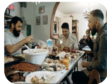
Skildring af familien