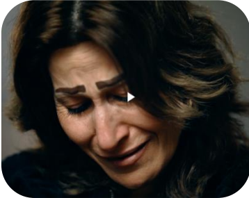
Nærbillede - identifikation