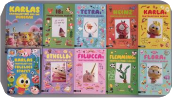
Lån Læsekasse – Karlas fantalastiske klasse