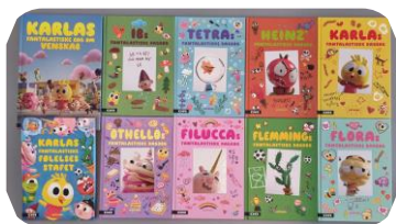
Lån Læsekasse – Karlas fantalastiske klasse