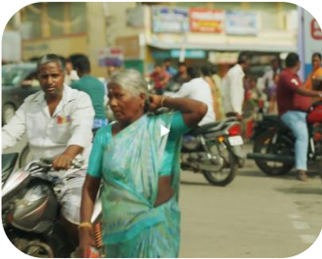
Byen Chennai, Indien