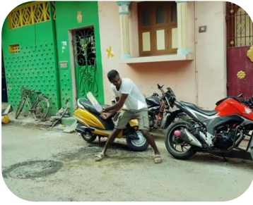
David spiller cricket i Chennai Iscenesættelse?