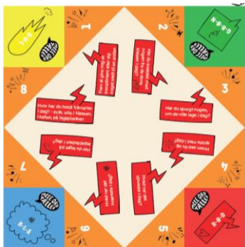
Nipnapper med samtalestartere