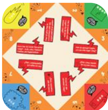
Eksempel på sætningsstartere