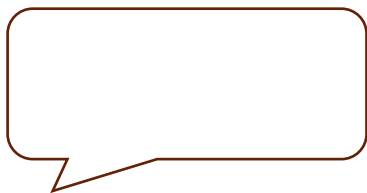
Eksempel på taleboble