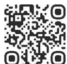
"Malthe er forsvundet"