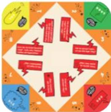
Eksempel på nipnapper

I projektet er der udviklet forskellige aktiviteter til print på bibliotekernes side, som kan bruges i undervisningen: