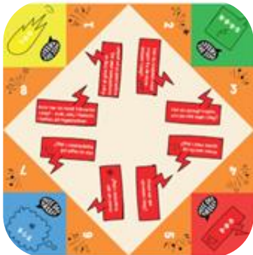
Eksempel på sætningsstarter

I projektet er der udviklet forskellige aktiviteter til print på bibliotekernes side, som kan bruges i undervisningen: