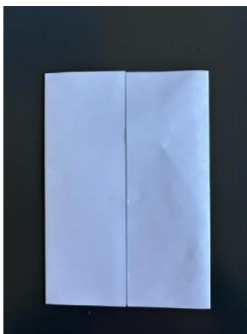
Skabelon til skabsbogen