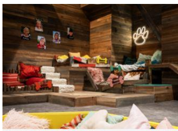
Baggrunde til stopmotion

På læsesportet findes både udfyldte kæledyrskort på Power, Chloé, Ollie og Messi og tomme kæledyrskort, som eleverne kan udfylde.