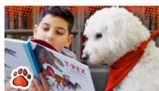
Ollie og resten af HundeBanden kan inspirere til at skabe tryktere rammer for læsning