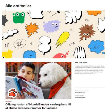
Ollie og resten af HundeBanden kan inspirere til at skabe trykrammer for læsning

HundeBanden er 12 tv-udsendelser fra DR Ramasjang, hvor de fire skønne hunde Power, Chloé, Ollie og Messi på skift optræder i forskellige scenarier.