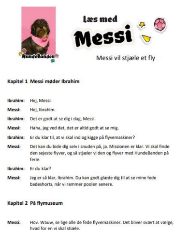
Uddrag af læseteater