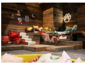
Baggrunde til stopmotion

På læsesporet findes både udfyldte kæledyrskort på Power, Chloé, Ollie og Messi og tomme kæledyrskort, som eleverne kan udfylde.