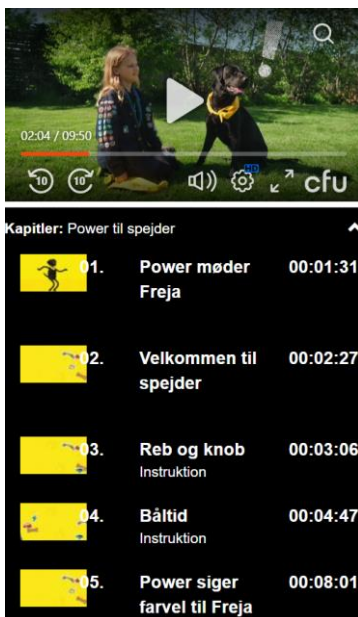
Oversigt over kapitelsættet