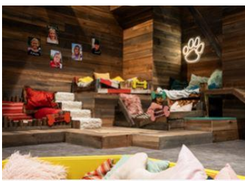
Baggrunde til stopmotion

På læsesporet findes både udfyldte kæledyrskort på Power, Chloé, Ollie og Messi og tomme kæledyrskort, som eleverne kan udfylde.