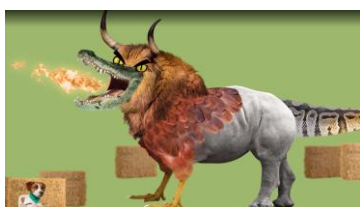
Et farligt dyr