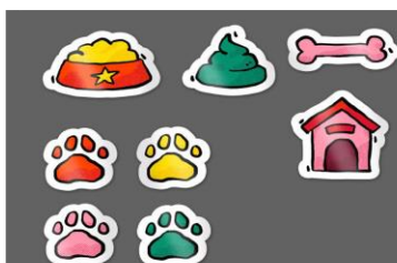
Se under supplerende materialer