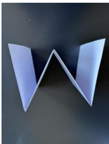
Skabelon til W-bog

Brug plakaten og lad dig inspirere af idéer til sætningsstartere og forslag til sprog, så du kan understøtte dine elever i skriveprocessen. For at alle dine elever kan lykkes med at skrive en beskrivende tekst, vil det være en fordel at skrive en modeltekst i fællesskab, så dine elever ved, hvordan de skal opbygge teksten.