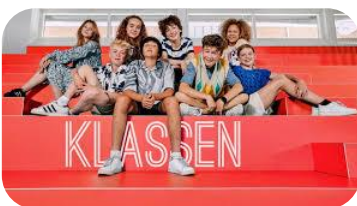
Klassen (Sæson 17) streamer du på mitCFU.

Dilemmaerne i 'Klassen'. Her skal eleverne fokusere på hvilke dilemmaer, der opstår i de afsnit de ser. Hvordan opstår de, hvad handler de om og hvordan løses de? Bagefter skal eleverne snakke om oplevelser og dilemmaer fra deres egen klasse, som kan indgå i deres film.