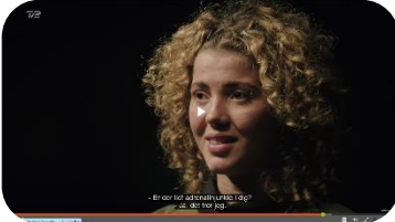
Fra Korpset på TV2

Se " Korpset " i fuld længde uden pauser. Følg derefter kapitelsættets nedslag og forslag til opgaver, hvor der er et særligt fokus på gameshowets design, temaet: lederevne og følgeskab samt Erwin Goffmans begreber om sociale roller: front stage og back stage .