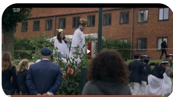
Fra Herlufsholm for livet på TV2