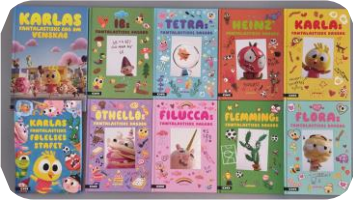
Lån Læsekasse – Karlas fantastiske klasse

Når dagbøgerne er skrevet, kan eleverne dele uddrag af den, men det er vigtigt at respektere, at en dagbog er en personlig tekst, som eleverne skriver til sig selv.