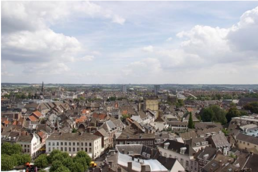
Maastrichttraktaten blev underskrevet af medlemslandenes regeringsledere i den hollandske by, men blev nedstemt af Danmark i 1992.

Den 2. oktober 1972 var der en folkeafstemning i Danmark. Den handlede om, hvorvidt Danmark skulle indtræde i EF (Det Europæiske Økonomiske Fællesskab). Seks lande – Frankrig, Vesttyskland, Belgien, Italien, Holland og Luxembourg – havde allerede i 1951 lavet Det Europæiske Kul- og Stålfællesskab. Dette samarbejde var forløberen for EF. Ideen var, at varer og mennesker frit kunne krydse landegrænser, og at samhandel kunne forebygge nye krige i Europa. Op igennem 1960'erne og start 70'erne gik diskussion om, hvorvidt Danmark skulle indtræde i EF. Ved folkeafstemningen i 1972 stemte et flertal (63,45 %) af danskerne for optagelse og medlemskabet var en realitet året efter.