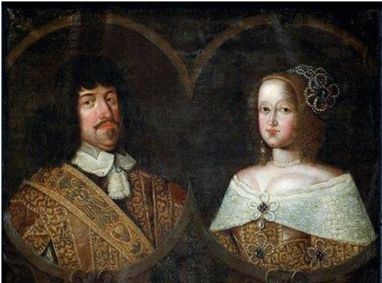
Maleri af Frederik 3. og dronning Sophie Amalie – lavet af Wolfgang Heimbach.

Wolfgang Heimbach var en tysk maler og én af Frederik d. 3. og Sophie Amalie favoritkunstnere, når de to skulle males. Lav en google-billedsøgning på Wolfgang Heimbachs malerier af de to. Hvordan forsøgte de to at fremstille sig selv? Sammenlign gerne med din egen selfie – er der store forskelle eller måske endda nogle ligheder?