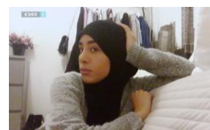
Billedet er fra dokumentaren på DR2 Oprør fra ghettoen (3)