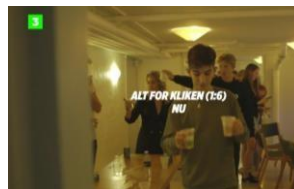
Billedet er fra dokumentaren på DR3 Alt for kliquen (1)