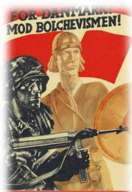
Dansk/tysk hverveplakat for kampen på østfronten.

Omkring 12.000 danskere meldte sig frivilligt til tysk tjeneste i kampen mod bolsjevismen (kommunismen) på østfronten i det såkaldte Waffen SS. Det var dog kun halvdelen af disse der blev erklæret eget til tjeneste og kom i kamp. Cirka 2.000 af disse blev dræbt i tysk tjeneste. Efter krigens afslutning ventede der de frivillige retssager og straf. Regeringen vedtog en lov, som med tilbagevirkende kraft ulovliggjorde tysk krigstjeneste.