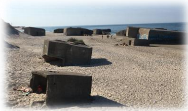
Bunkerne på stranden ved Vigsø.

På den jyske vestkyst blev mere end 7.000 bunkere og fæstningsanlæg bygget i løbet af besættelsestiden. Disse skulle beskytte den tyske besættelsesmagt imod invasion fra engelsk/amerikansk side. Byggeriet toppede i 1943 hvor det samlet set var Danmarks største arbejdsplads. Lønnen var høj og eftersom der ellers var høj arbejdsløshed i landet, var arbejdet eftertragtet, men kunne man tillade sig at arbejde for tyskerne?