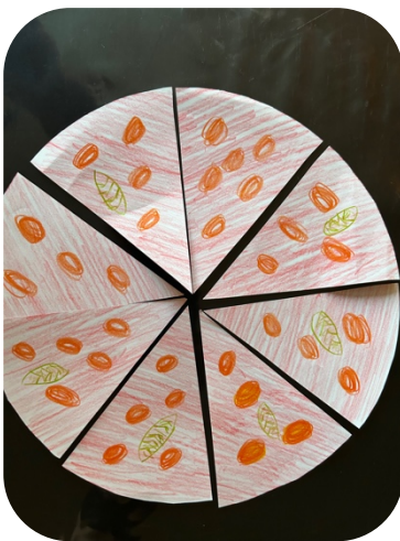
Eksempel på elevprodukt. Hjemmelavet pizza. Eleverne kan lave små ordkort til, som viser, hvad der er på deres pizza.

En lapbook er en variation af en foldebog, hvor eleverne tegner og skriver om et givent emne.